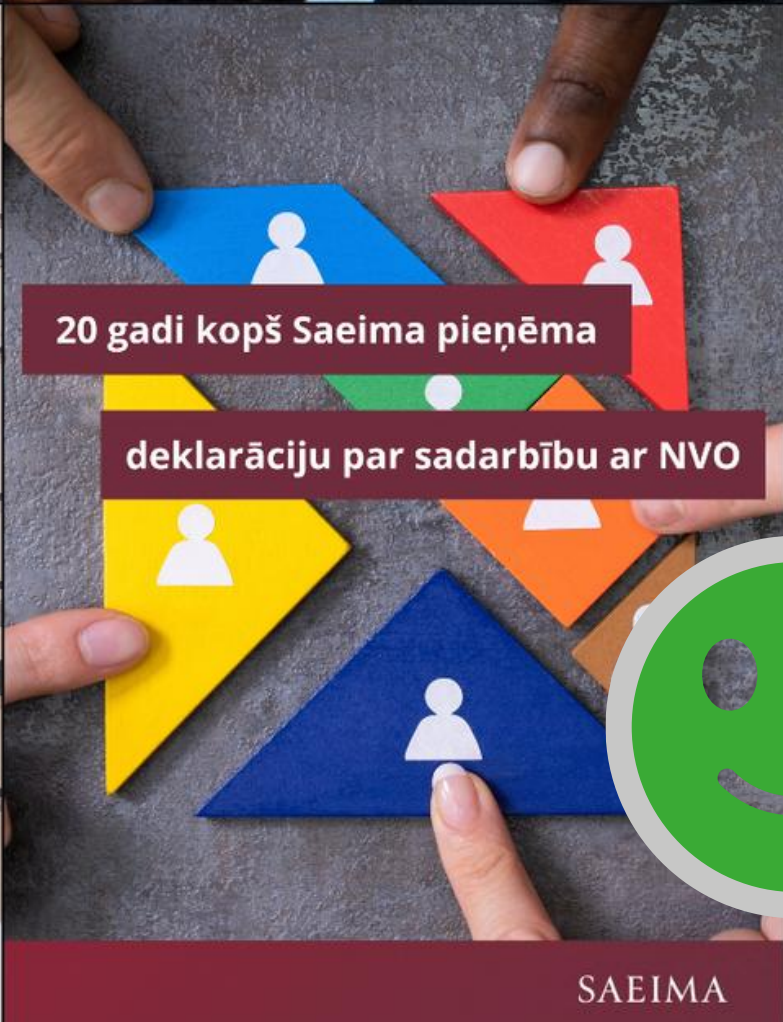
20 gadi kopš Saeima pieņēma