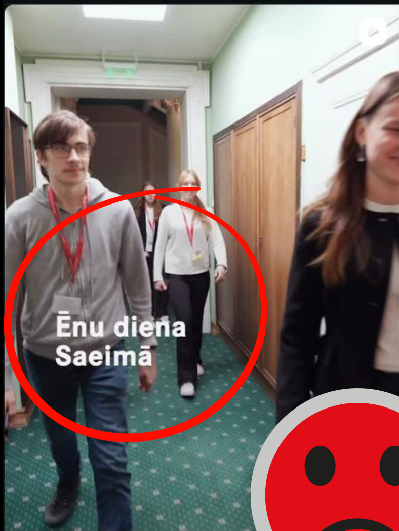
Ēnu diēna Saeimā