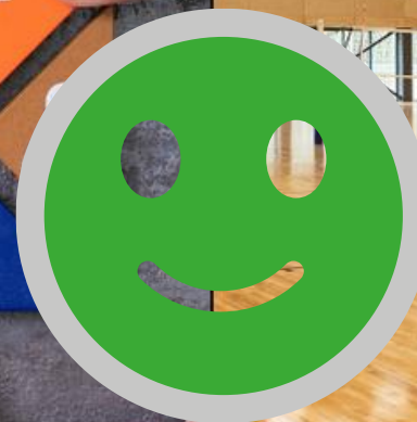
deklarāciju par sadarbību ar NVO