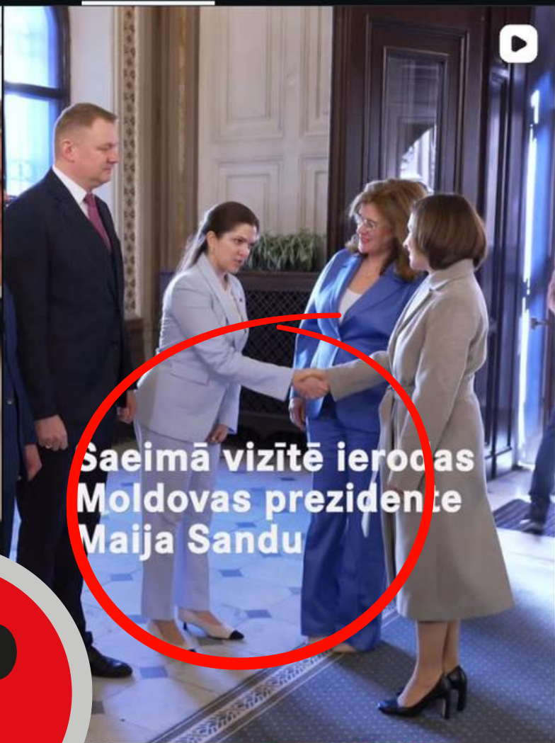
Saeimā vizītē ierodas Moldovas prezidente Maija Sandu